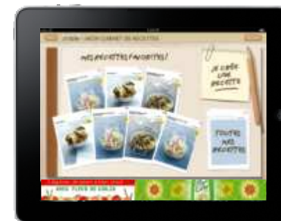
Mon carnet de recettes