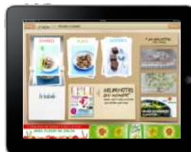
Les fiches cuisine