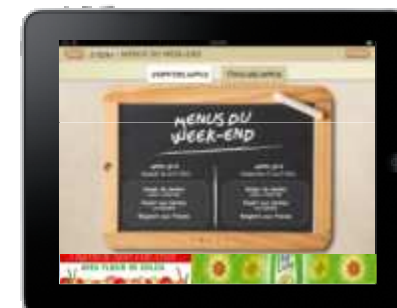
Les Menus du week end